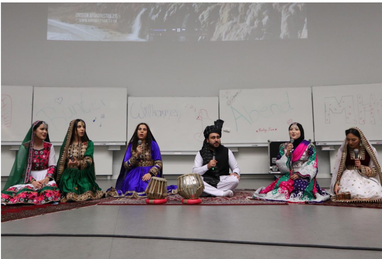
BUNTER ABEND: Die Afghanische Gesangsgruppe eingekleidet in traditionell afghanischen Outfits.