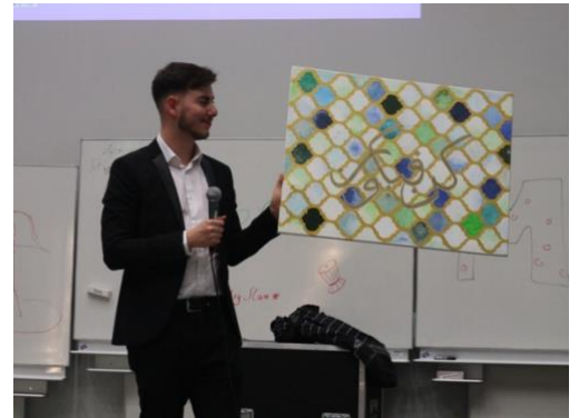
Hier sehr ihr das Gemälde, das versteigert wurde.