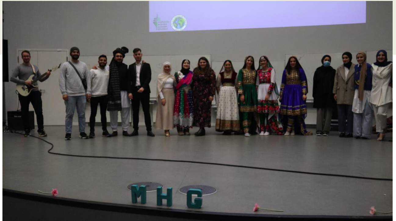
BUNTER ABEND: Alle Künstler versammeln sich auf der Bühne und beenden den Abend mit einem schönen Abschlussfoto.