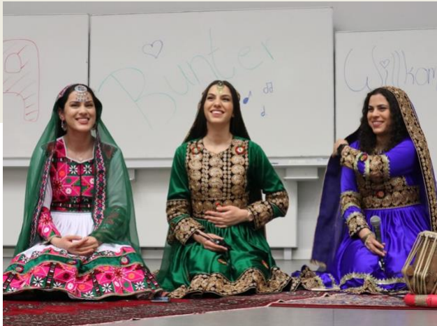
BUNTER ABEND: Afghanische Gesangsgruppe